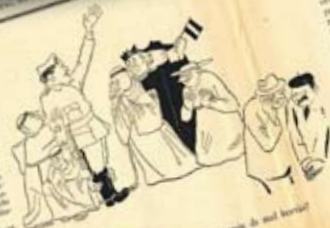
— I he, senyor Canals, i a la casa vostra de mol horitzons — — No tinc pas cap horitzó, senyor Canals.