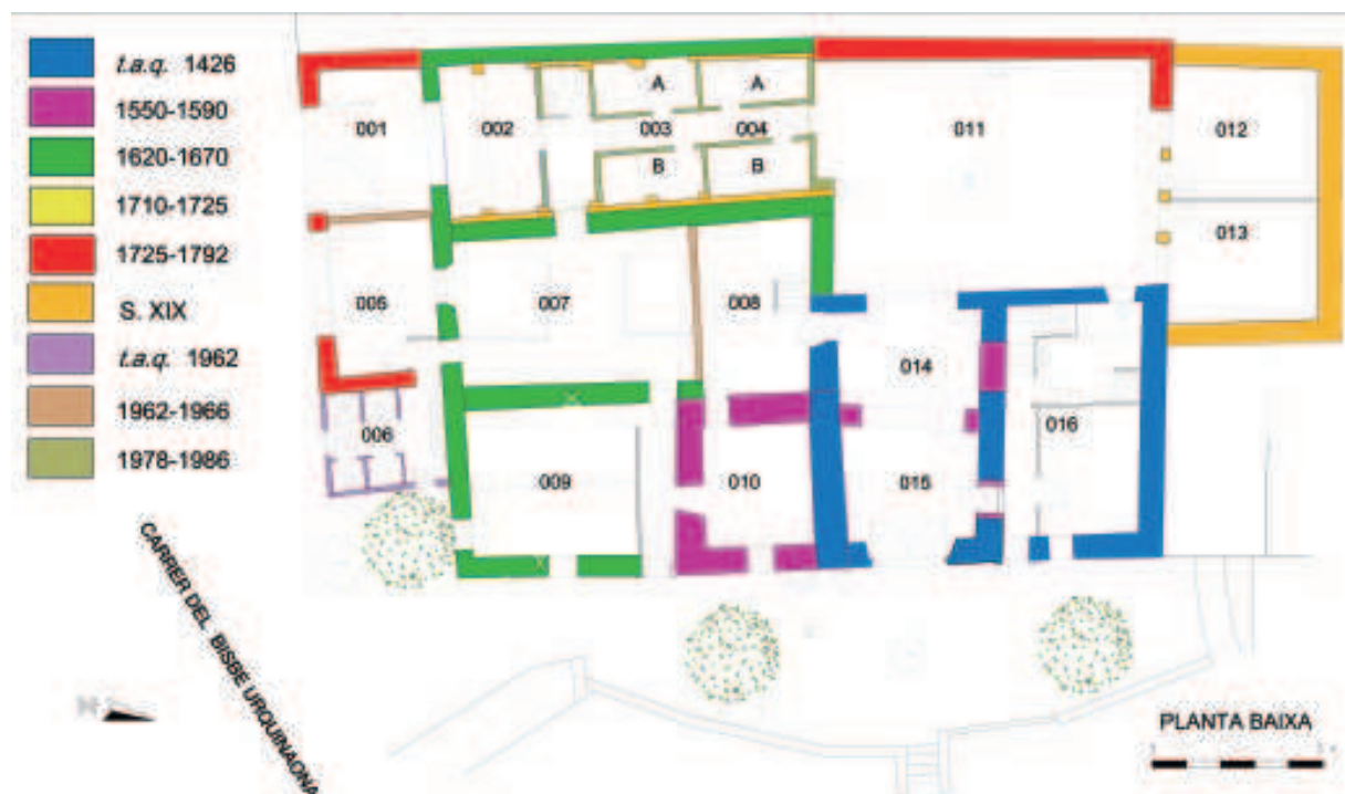
Planta baixa de la casa amb indicació cromàtica dels horitzons establerts.

Entre 1966 i 1978, l'antiga masia es va fer servir com a seu de diverses entitats i com a Delegación Local de Sindicatos , sense variar-ne la configuració arquitectònica. En 1978, l'Ajuntament en va cedir l'ús al Cos Nacional de Policia, perquè hi instal·lés la comissaria, que va funcionar fins al mes de juliol de 2008. Tenim notícies que, al principi d'aquest període, es van fer obres de pavimentació, arrebossats, pintura, vidriera, etc., i es van bastir elements inherents a la nova funció de l'edifici, com ara les cel·les i el lavabo dels àmbits 003 i 004. En 1986 es van tornar a fer obres de consolidació i reforma, en el decurs de les quals es van substituir alguns paviments de rajols per rajoles de gres. Aquestes obres es van fer d'acord amb l'informe que, l'any 1984, havia redactat l'arquitecte municipal, on s'establien les condicions bàsiques que s'havien de tenir en compte en la intervenció per tractar-se d'un edifici de valor històric, arquitectònic i ambiental que estava inclòs en l'Avanç de Catàleg i la Especial de Protecció i Rehabilitació de Patrimoni Arquitectònic de Castelldefels.