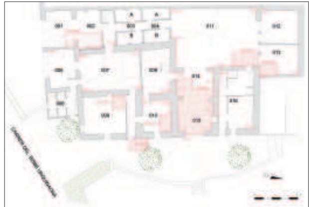
Planta baixa de la casa amb indicació de les cales i sondeigs realitzats.

En iniciar-hi els treballs, era palès que la masia estava formada per una sèrie de cossos juxtaposats al llarg del temps. Com que la informació que se'n tenia havia estat obtinguda únicament a través del reconeixement superficial de les seves fàbriques, calia aprofundir-ne en l'estudi de l'estructura general, esbrinar-ne la configuració en cadascuna de les etapes històriques, determinar la cronologia relativa i absoluta d'aquests períodes i, amb l'ajut de les fonts escrites i de l'anàlisi artística, copsar el significat dels seus elements. Atès que la disponibilitat temporal i econòmica era relativament limitada, es va decidir donar protagonisme a l'estudi dels paraments de la casa, per palesar les relacions estratigràfiques d'anterioritat/posterioritat en les seves superfícies verticals. Per tant, es va optar per obrir cales en aquells punts on els resultats permetessin establir la relació entre dos o més murs o bé on, per tractar-se de façanes originals o cossos afegits, aportessin informació addicional. A més, es va plantejar la realització d'onze sondeigs al subsòl.