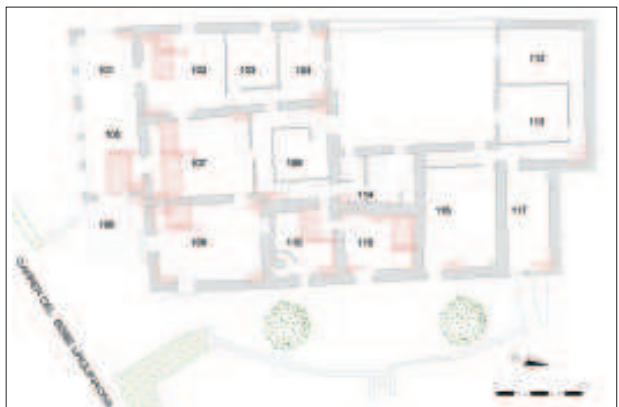
Primer pis de la casa amb indicació de les cales i sondeigs realitzats.

Aquestes recerques, que són habituals en el mètode de treball de l' SPAL (p.e. López Mullor 2010), havien de servir per identificar-hi probables restes de la masia original i datar alguns dels murs principals de l'edifici que ens ha pervingut, així com per comprovar les relacions de diacronia entre els seus diferents elements. Tot seguit, resumim les conclusions d'aquests estudis.