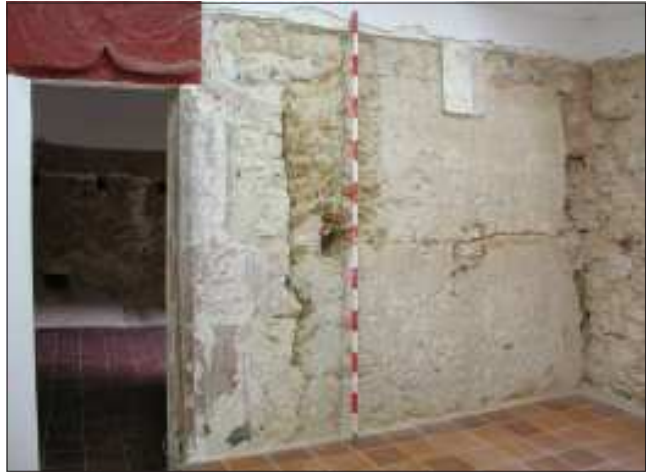
Part del mur de migdia del mas original. En bastir-se la torre, s'hi va obrir una porta de comunicació.

Els elements més antics documentats en el decurs dels treballs corresponen al cos de tramuntana del conjunt, que conformaria el mas original. Es tracta dels actuals àmbits 14 a 16, amb parets de maçoneria de pedra calcària a la planta baixa i de tàpia al primer pis. D'aquesta darrera fàbrica se'n van va poder determinar la construcció en encofrat per caixons, en l'àmbit situat a migdia de la torre. Aquestes estructures, que es van anar identificant a partir de les cales realitzades als paraments, conformaven un mas del tipus I de dos cossos o crugies, segons la tipologia de Josep Danès (1931; Barbany et al. 1996, 117), de planta rectangular, de 10 x 8 m, orientat cap a llevant, teulada a dues vessants i el carener perpendicular a la façana principal. És probable que la porta d'aquesta casa fos l'antecedent del portal adovellat localitzat a la façana de migdia en el decurs dels treballs, però probablement força més senzilla. D'altra banda, en la paret mitgera entre els dos cossos, la que es va trobar en més bon estat gràcies al potent arrebossat que la cobria, s'hi van poder documentar les portes de comunicació entre les dues crugies: la de la planta baixa, a l'extrem de ponent, i la del primer pis, al de llevant, totes dues tapiades en diferents moments.