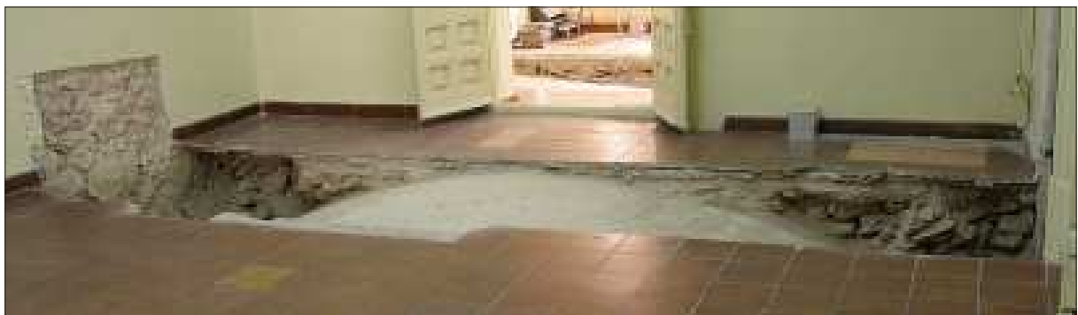
Volta descoberta en el decurs dels treballs a l'àmbit 107, datades del darrer quart del segle XIX.