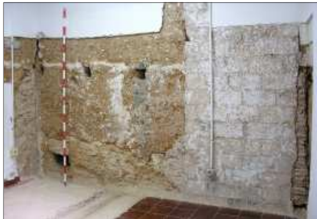
Mitgera entre els dos cossos del mas original, feta amb caixons de tàpia sobre sòcol de pedra.

Si bé sabem que aquestes són les parets més antigues conservades al mas, no se n'ha pogut establir la datació absoluta, ja que l'excavació al subsòl de la casa no va proporcionar estrats que s'hi relacionessin. A més, la seva tècnica constructiva, amb sòcol de maçoneria de pedra local i pis alt de tàpia, és la tradicional del país, utilitzada en les construccions populars, sense solució de continuïtat des de l'antiguitat. En aquest cas, però, la seva situació dins el conjunt, en posició central i amb tota la resta dels cossos que el componen adossats, aquests murs s'han de situar, com a poc, abans de 1426, data del capbreu més antic de Castelldefels que es coneix. Tant en aquest document, com en el següent d'aquesta mena, de l'any 1460, on s'esmenten els masos del poble, l'únic que limitava al nord amb la costa del castell i que, per tant, es podria identificar amb can Roca de Baix, és el de Pere Costa, qui declarava tenir el mansum suum vocatum Costa cum terris, honoribus et possessionibus suis , el qual limitava a llevant amb les possessions de Joan Colomer, a migdia i Orient amb les de Ferrer Janer, i al nord amb