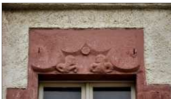
Finestra del primer pis oberta en el cos original de la casa.