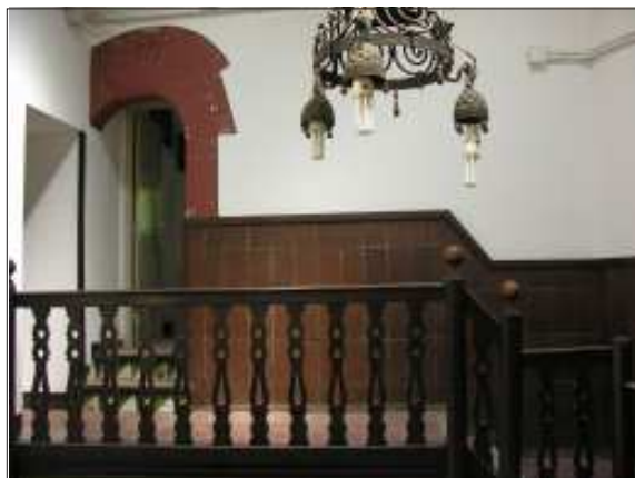
Porta de la torre, situada al costat de ponent, avui a l'interior de l'edifici.

A l'interior del mas es van identificar altres elements constructius i decoratius corresponents a aquest mateix horitzó cronològic. Cal esmentar-ne, la porta que comunicava els dos cossos del mas inicial, oberta en tapiar l'original, situada a l'extrem de ponent. Està acabada amb una llinda monolítica decorada