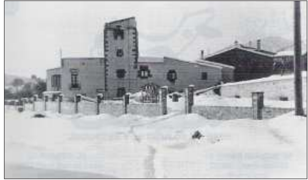
Can Roca de Baix l'any de la nevada de 1962.

obres, com les de Can Roca de Dalt, no es van enllestir del tot fins al darrer decenni del segle XVIII. Potser, el cos nord-oest (012-013) sigui de la mateixa data, tot i que no és gaire expressiu des del punt de vista tipològic i les recerques arqueològiques del subsòl no han proporcionat cap informació, en aparèixer tot seguit el terreny natural.