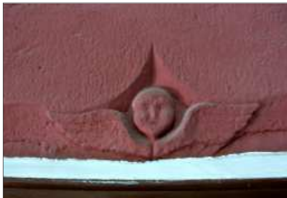
Llinda de la porta de comunicació entre els dos cossos del mas original, oberta en el decurs de l'horitzó B.