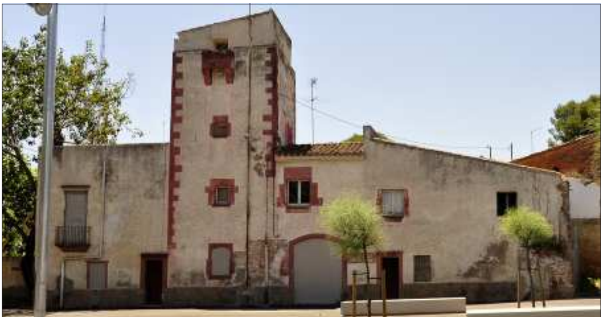
Aspecte actual de la façana principal del conjunt.

Aquestes recerques, que són habituals en el mètode de treball de l' SPAL (p.e. López Mullor 2010), havien de servir per identificar-hi probables restes de la masia original i datar alguns dels murs principals de l'edifici que ens ha pervingut, així com per comprovar les relacions de diacronia entre els seus diferents elements. Tot seguit, resumim les conclusions d'aquests estudis.