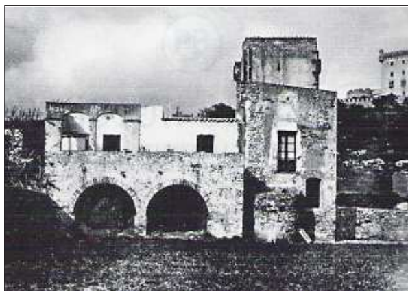
Façana sud de la masia en el decurs de la primera meitat del segle XX. S'observa com és el cos de migdia del conjunt a sobre del qual només s'obderven dos arcs carpanells. A llevant, també es poden veure alguns dels vestigis dels esgrafiats diposats en el decurs de l'horitzó E.

La fàbrica emprada en aquest horitzó és bàsicament de totxo ceràmic massís, que és la que s'observa en la façana de migdia, on els arcs van ser fets amb el mateix material disposat al sardinell, o bé de maçoneria de pedra i fragments de totxo lligats amb morter de calç. Al interior de l'edifici, ha un altre detall que permet afirmar que les reformes van afectar força la primera planta. Es tracta de les portes que comuniquen les diverses crugies, totes acabades en arcs idèntics, mixtilinis d'estil barroc. Aquests arcs, freqüents a les alcoves privades de les cases senyorials i també en algunes masies, se situen estilísticament avançat el segle XVIII. Se'n troben de semblants en una porta de la casa Solà Morales d'Olot (Pi de Cabanyes 2002, 198), datada de cap a 1781, al Noguer de Segueró de Maià de Montcal ( Ibid , 177), de mitjan segle XVIII, a l'Espona de Saderra d'Orís, casal del segle XVIII (Ferrer i Alòs 2003, 183), a la casa Masferrer de Sant Sadurní d'Osormort (Gonzàlez, Moner, Ripoll 2005, 120), amb nombroses ampliacions datades del segle XVIII, o a Can Batlle de Riudellots de la Selva, masia senyorial bastida entre l'any 1703 i el 1773 (Pi de Cabanyes 2002, 100).