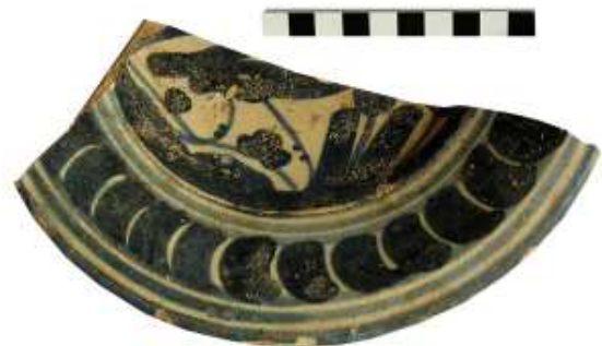
Fragment d'un plat de ceràmica blava catalana amb orla de la ditada trobada en el sondeig VI.

En aquest cas, la recerca arqueològica en el subsòl sí que va contribuir a ajustar la data de l'horitzó, ja que els sondeigs V i VI, oberts als àmbits 002 i 009 respectivament, van aportar material abundant corresponent a mitjan segle XVII, època, per tant, de fundació de tot aquests cossos. Es tracta d'un conjunt abundant de fragments de l'anomenada ceràmica blava catalana, corresponents tant a plats com a escudelles, datats entre el 1620 i el 1670, moment àlgid de la