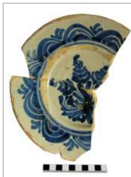
A l'esquerra, vista final del segon sondeig, obert al vestíbul, on s'observa un paviment de rajols i les cobertes de sengles dipòsits. A la dreta, fragment d'un plat de ceràmica blava catalana del tipus «de Poblet».