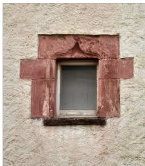
Finestra amb un arc conopial del primer pis de la torre.

Es tracta d'una decoració molt similar a la de la finestra oberta en el mateix àmbit, a la façana de llevant, amb nombrosos paral·lels a Castelldefels i arreu de Catalunya. En el primer cas podem citar, a tall d'exemple, les nombroses finestres del cos més antic del castell, bastit cap al 1550, una del segon pis de la torre d'en Gabriel Folcher, datada de 1560, una altra de la torre de n'Antoni Janer, de 1558; o les de la façana principal del mas La Goma o can Gomar, actual casal de Cultura. Val a dir que, a la façana de llevant de la planta baixa de la torre mateixa, s'obre una altra finestra, decorada amb una roseta central, com les que també es poden veure a la Goma. Resta pendent l'obertura d'una cala parietal que s'hi relacioni, ja que resulta poc pràctic, des del punt defensiu, la seva presència tant a prop del nivell de circulació exterior i podria ser que fos una mica més tardana que les altres, o que hi hagués estat reposicionada en un moment posterior al de