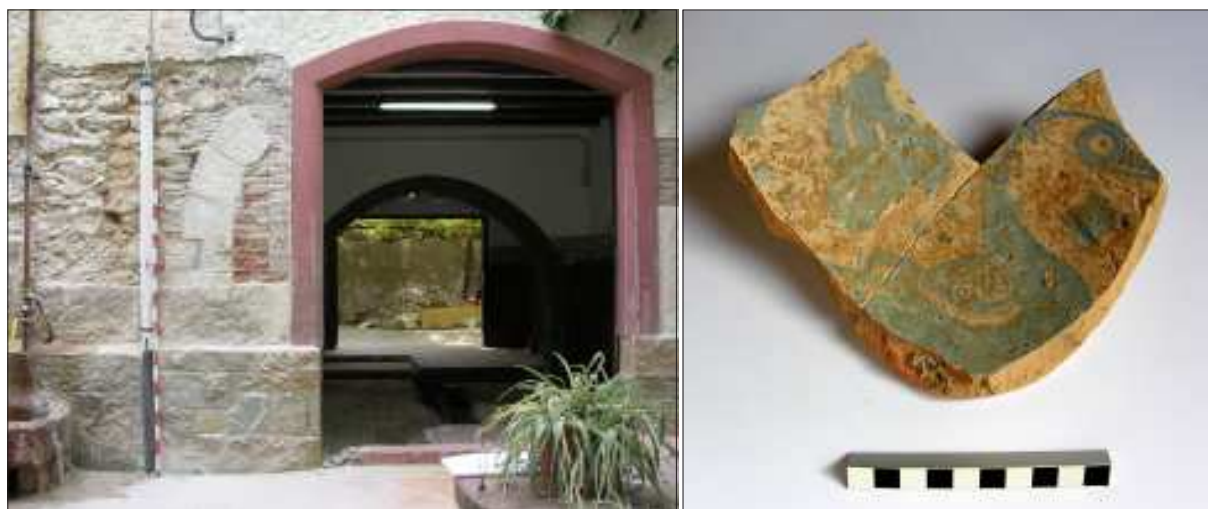
A l'esquerra, una cala oberta a la façana principal va permetre part de les dovelles d'una porta anterior a l'actual, adscrita a l'horitzó B. A la dreta, fragment de plat de ceràmica blava de Barcelona trobat al sondeig I.

Entre els elements que hem utilitzat per a la datació d'aquest horitzó cronològic, cal esmentar en primer lloc el material ceràmic trobat en el subsòl, el qual va ser escàs. Hi destaca la base d'un plat de ceràmica blava dita de Barcelona, producció que cal situar entre c. 1400 i c. 1610 i que va tenir la seva implantació màxima en el mercat entre 1450 i 1575 (Parera 1997, 1998). Es va trobar en l'únic sondeig obert a l'exterior de l'edifici, en un rebliment que servia de preparació per a un paviment de calç, de gruix considerable, el qual també es va documentar al segon sondeig. En aquest darrer cas, el paviment s'associava a l'arc que articula el vestíbul, fet decisiu per a la seva adscripció en aquest