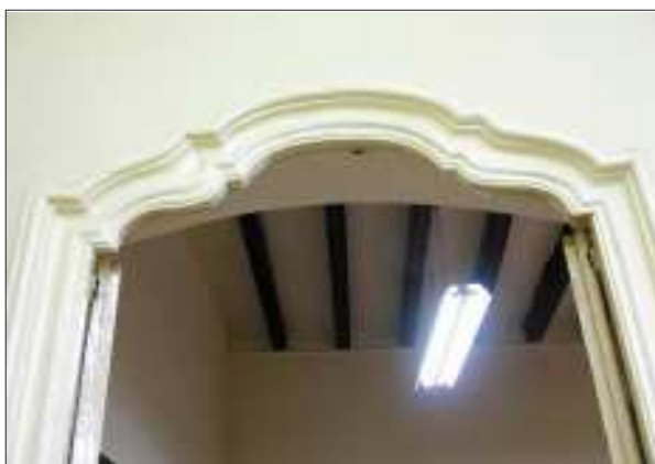
Detall d'una de les portes de l'interior del mas, acabada amb arc mixtilini.