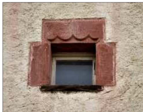
Finestra amb arcs lobulats del segon pis de la torre.