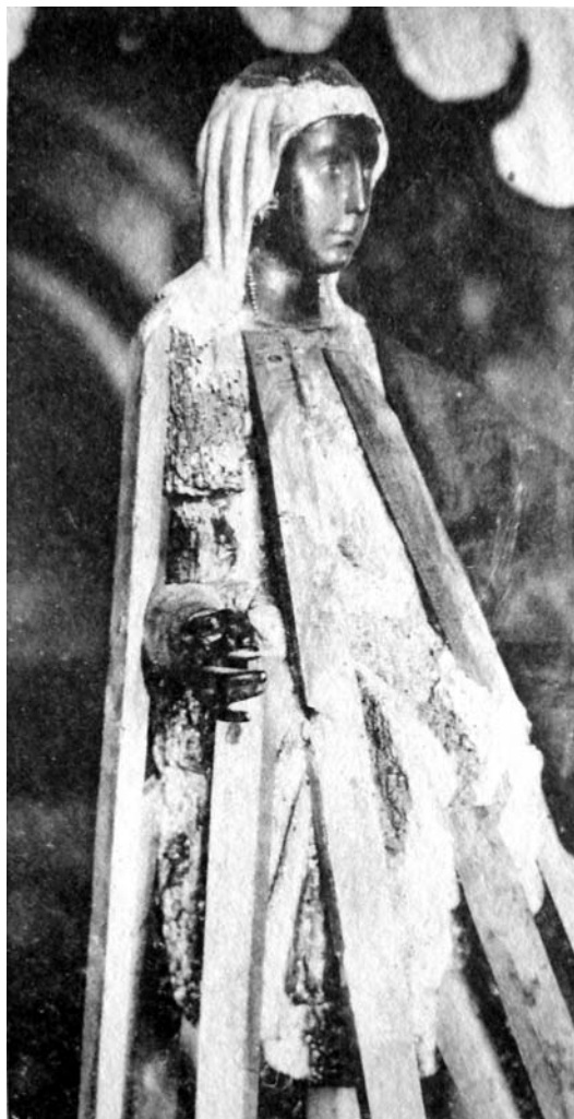
Verge de Castelldefels antiga; imatge tal com apareix al llibre de Bofarull citat en l'article.

recuperació de la identitat cultural, institucionalitzarà un excursionisme que haurà de recollir el folklore que es vincula a la terra. 4 L'interès per conèixer la geografia de les terres del Principat, amb llur riquesa, arribarà a Castelldefels. Referint-se a aquest moment històric s'ha dit que "Castelldefels al parecer estaba de moda como destino de expediciones barcelonesas. En varias revistas de la década de 1880 aparecen algunos relatos de algunas de ellas". 5 La narració d'una d'aquestes excursions revela de quina manera el poble considera d'on prové la seva patrona i com ho mostren visualment. La descripció del temple parroquial que llegim és la que fa Masriera: