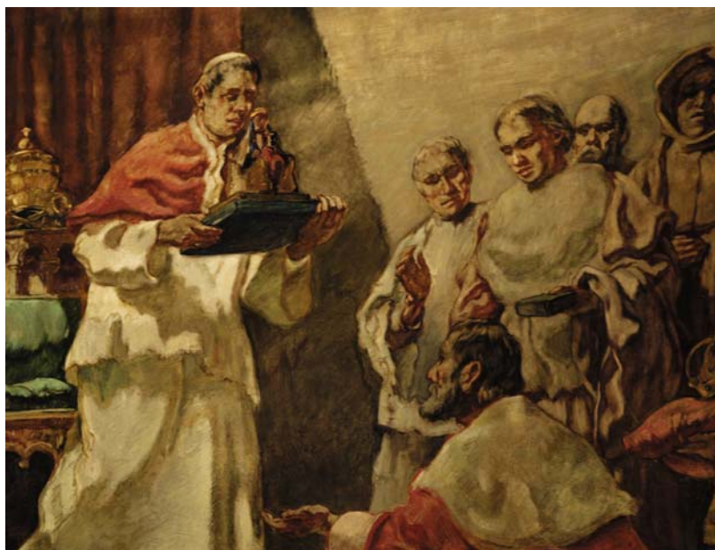
Detall de la pintura mural de Serrasanta, al temple de Santa Maria de Castelldefels.

El document de l'any 986, que explicaria el suposat origen de la imatge de Castelldefels, és una novetat absoluta. No ens havia aparegut en la relació que inquiria Alonso de Zamora, al XVIII; tampoc havia transcendit que existís quan s'interessen per l'arxiu parroquial els expedicionaris embarcats en els projectes de recuperació del passat històric propi de la Renaixença catalana, al XIX. Ens sobta la seva citació en un petit opuscle, en el primer terç del XX... i desapareix per sempre més poc després ja que, el citat manuscrit, d'haver estat conservat efectivament a l'arxiu de la rectoria de Castelldefels hauria compartit el tràgic destí de ser cremat, el 1936, durant la profanació de la nova església de Santa Maria. Saquejada i més tard incendiada, l'edificació va veure com es perdien les imatges antigues, així com tots els