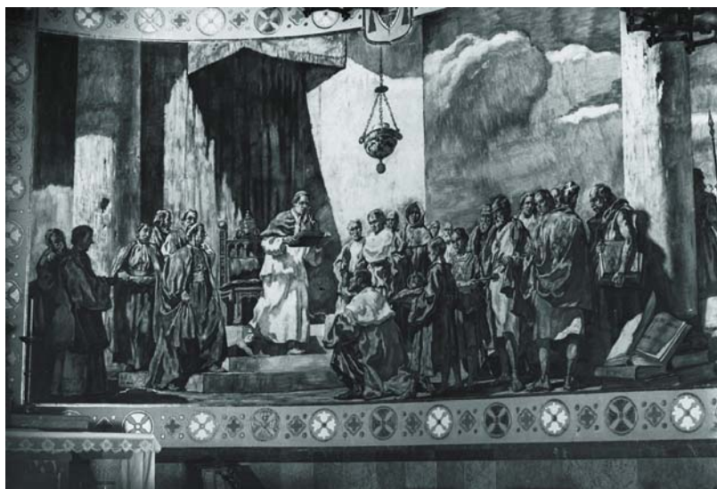
Pintura de Serrasanta que ens remet al lliurament de la marededéu a Carlemany.

tat, amb aquesta observació, la barrera temporal i, si ens ho volem imaginar, veiem com a possible que el “restaurat” monestir del que es parla en el segle X, hagués estat funcionant des de temps anteriors... i ens podem ficar retroactivament en l'època del nostre protagonista, Carlemany.