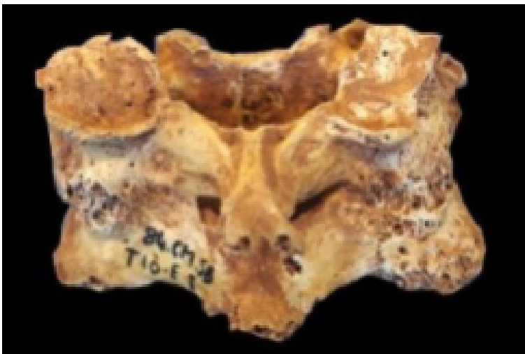
Imatge.1: Fusió de les cervicals 3 i 4 de l'individu 10-1

En aquest sentit, les dones són les que presenten un pitjor estat de salut en general, amb una major